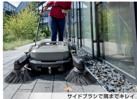
サイドブラシで隅までキレイ