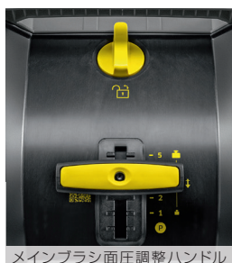
メインブラシ面圧調整ハンドル

700mm、もしくは980mm(2SB)の作業幅と大容量ダストコンテナが、広がっている落ち葉などを回収。メインとサイドブラシは両輪駆動のため、左右どちらに曲がっていてもゴミを回収します。メインとサイドブラシは床に対しての面圧を調整可能です。