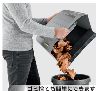
ゴミ捨ても簡単にできます

押して歩くだけで効率良く清掃できます。ハンドルの高さは身長に合わせて3段階に調節でき、楽な姿勢で作業が行えます。扱いやすい軽量ボディは衝撃に強いプラスチック製で、サビや凹みの心配がありません。