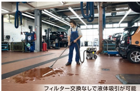
フィルター交換なしで液体吸引が可能