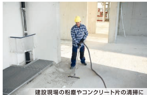
建設現場の粉塵やコンクリート片の清掃に