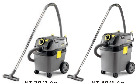
NT 30/1 Ap NT 40/1 Ap 実際の現品は写真と異なることがあります。