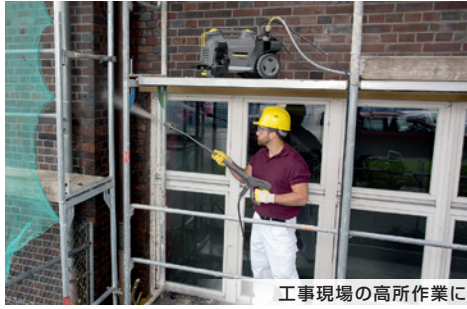
工事現場の高所作業に