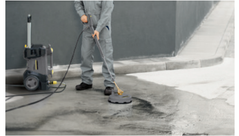
犬走りや外床、外壁の洗浄に(オプション:FR 30 P使用)