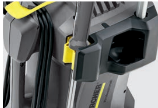
ランス固定ホルダー